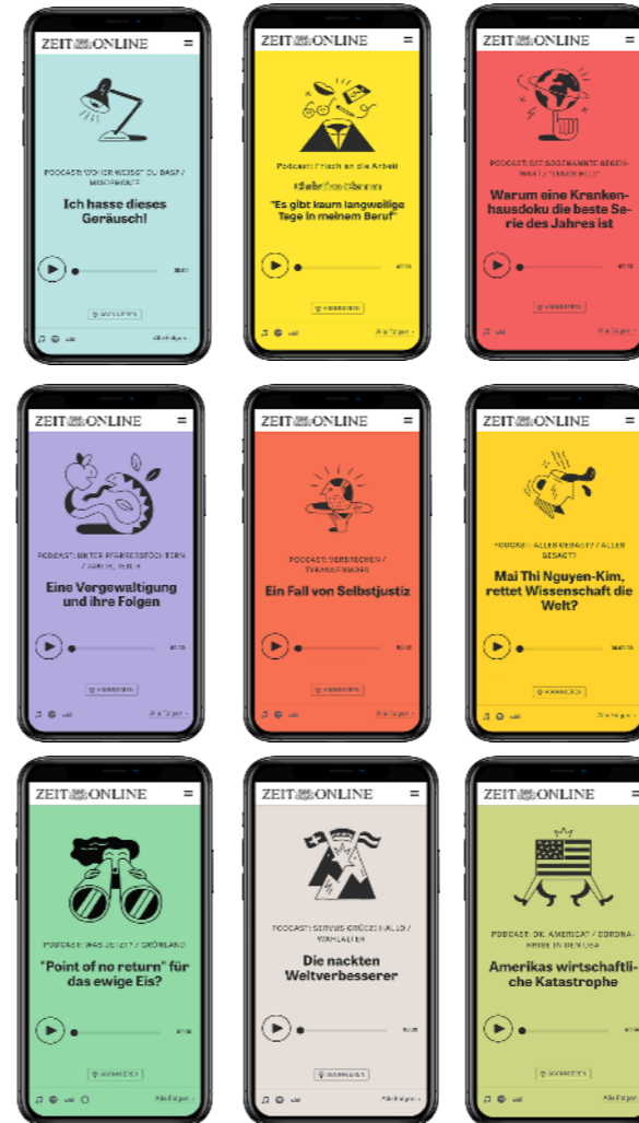
Auswahl. Änderungen vorbehalten.

ZEIT ONLINE produziert die reichweitenstärksten Qualitätspodcasts in Deutschland.