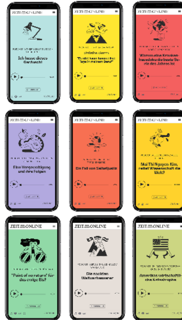
Auswahl. Änderungen vorbehalten.

ZEIT ONLINE produziert die reichweitenstärksten Qualitätspodcasts in Deutschland.